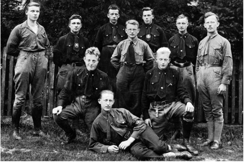
Abbildung 2 – Im Gegensatz dazu die ebenfalls 1926 abgelichtete Artamanschaft in Ellerndorf bei Eimke (Provinz Hannover). Die rein männliche Gruppe trägt teilweise Uniformen mit Totenkopf- oder NSDAP-Parteiabzeichen und steht damit eher in der Tradition der Wehrbünde.