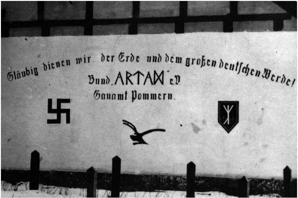
Abbildung 3 – Das «Gauamt Pommern» des Bundes Artam in Großenhagen. Auf der Wand sind der Wahlspruch der Artamanen: «Gläubig dienen wir der Erde und dem großen deutschen Werde!», die Bundesbezeichnung in Runenschrift, ein nach rechts gewinkeltes Hakenkreuz, ein Pflug und das Bundeszeichen, die «Artam-Rune» aufgemalt. (Bildausschnitt.

Dass sich die Bundesführung der Artamanen, zwecks möglichst populären Auftritts in der Öffentlichkeit, extremer Positionen völlig enthielt, ist allerdings ein Trugschluss, wie das Beispiel Deutsche Arbeiterzentrale (DAZ) zeigt. Die staatliche DAZ vermittelte ab Sommer 1927 arbeitslose junge Menschen an die Artamanen, finanzierte Vermittlungs-, Reise- und Ausstattungskosten, was für den Bund Artam «aus wirtschaftlicher Sicht ein bedeutender Vorteil» 21 war. Die Unterstützung durch die DAZ wurde allerdings an die Bedingung geknüpft, dass jegliche politische Zusatzvereinbarungen zu unterbleiben hätten. Als 1928 ruchbar wurde, dass die Artamanen Verträge mit den Gutsbesitzern geschlossen hatten, die ein Streikverbot und einen gelockerten Kündigungsschutz aus ideologischen Gründen beinhalteten, zog sich die DAZ mit sofortiger Wirkung aus der Vermittlungstätigkeit für die Artamanen zurück.