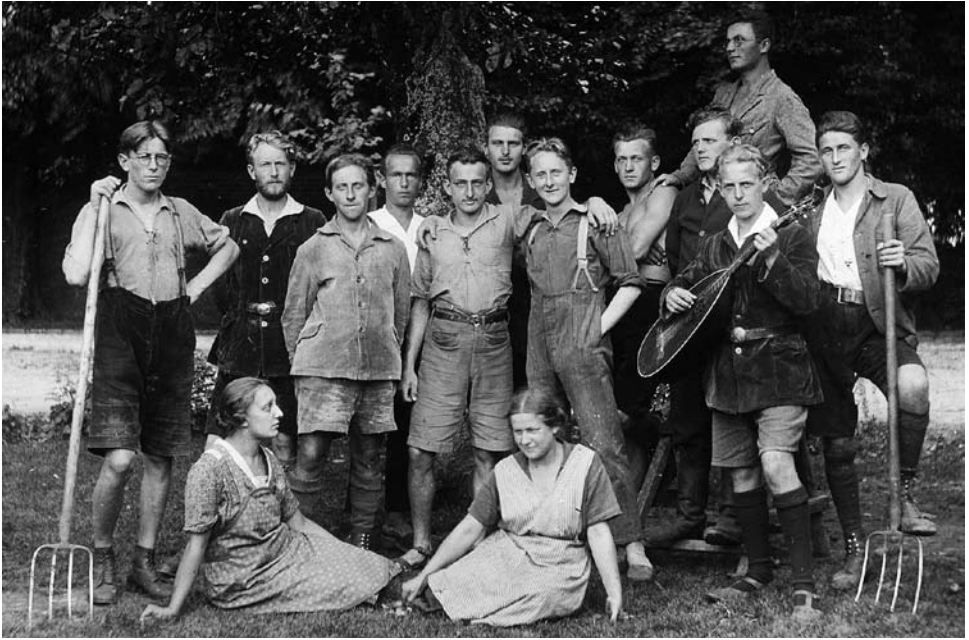
Abbildung 1 – Die Artamschaft Großenhagen in Pommern präsentierte sich 1926 von der Kleidung und Bildsprache her als koedukative «bündische» Gruppe.